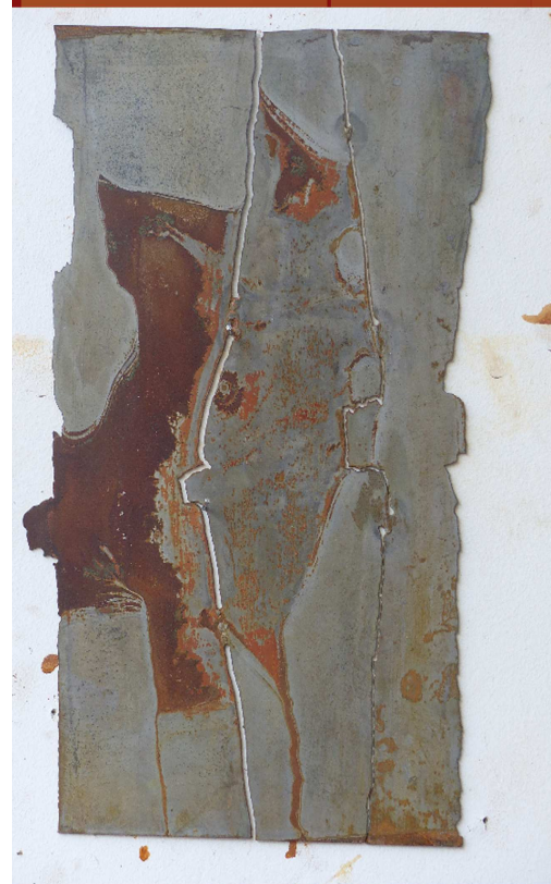
Œuvre de Gilles du Bouchet

Colloque international 12-13 octobre 2016